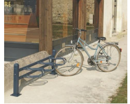
APARCABICICLETAS MODULABLE CONVIALE®

Realizados en tubo de acero galvanizado , utilizables por ambos lado. Permiten enganchar todo tipo de bicicletas . Para fijar al suelo mediante agujeros en las placas laterales.