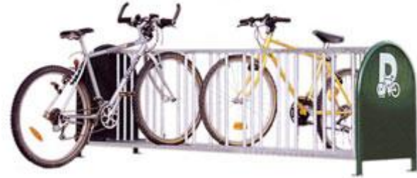
APARCABICICLETAS DE 16 PLAZAS

Fijación por sellamiento directo o sobre base.