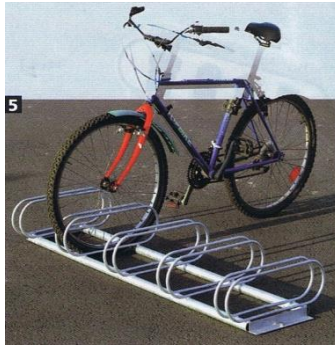
APARCABICICLETAS PROECO DE 5 PLAZAS

Realizado en acero galvanizado . Posibilidad de añadir cuantas extensiones desee . Permite enganchar todo tipo de bicicletas . Para fijar al suelo mediante agujeros sobre placas laterales.