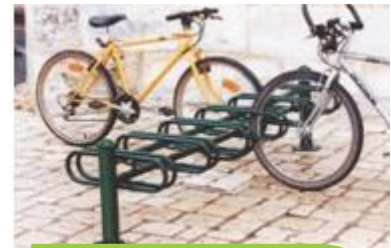
ARCABICICLETAS DECORATIVO MODULABLE (VARIAS PLAZAS)