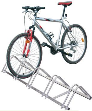
APARCABICICLETAS MODULAR INFINITE