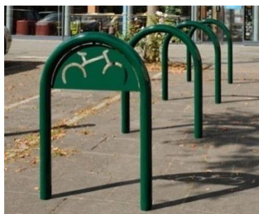
BARANDILLA CLIP (CON SEÑALÉTICA)