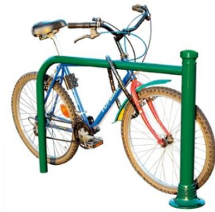
BARANDILLA PARA BICICLETAS Y MOTOS

Fijación fácil de antirrobo al marco de la bicicleta.