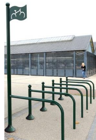
BARANDILLA PARA BICICLETAS Y MOTOS (CON SEÑALÉTICA)